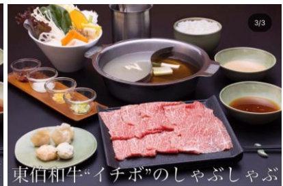
牛タンのしゃぶしゃぶ